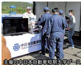
主催の中日本自動車短期大学ブース

Econo Power in GIFUは「省エネカー」・「ハイブリッドカー」・「電気自動車」に分類されたカテゴリーでいかに低燃費で効率良く走ることができるかを競う大会です。学校法人神野学園 中日本自動車短期大学が主催し、これまで22年間開催されてきましたが今年はコロナの影響もあり開催をするべきか検討されてきました。この大会に向け日々準備を進めている高校生達の情熱に応えたいと、昨年度に続き今年度も愛知・三重・岐阜の東海三県から高校生クラス限定で開催が決定。JU岐阜もこの大会の趣旨に賛同しプロジェクト委員会を立ち上げ今年から協賛として大会をサポートしています。各カテゴリーでエントリーされた車両がいかに低燃費で効率良く走ることができるか？ 1リットルのガソリンでどれくらいの距離を走行できるのか？ 高校生達の真剣に取り組み姿と熱いレースを取材してきました。