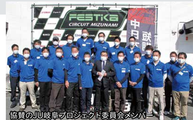
協賛のJU岐阜プロジェクト委員会メンバー