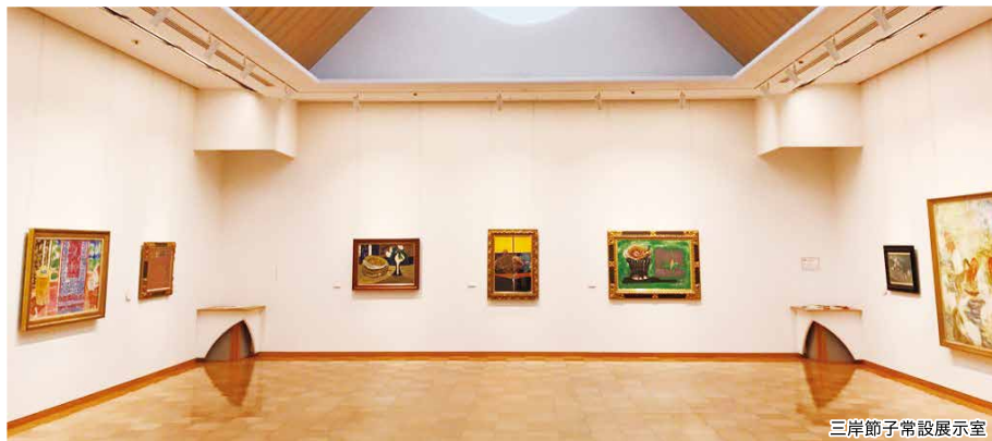
三岸節子常設展示室

愛知県尾西市(現・一宮市)の名誉市民である洋画家・三岸節子(1905~1999)。節子の生家跡に建設され、1998(平成10)年11月3日に開館しました。かつて敷地内にあった織物工場を思わせるノコギリ形の屋根や、節子の生前から残る土蔵を改修して愛着の品々を並べた土蔵展示室、風景画のモチーフとなったヴェネチアの運河をイメージした水路、生前好んだ白い花の咲く木々など、節子の思い出と深くかかわった建物です。住宅街のなかに佇むおしゃれな美術館を訪れてみてはいかがでしょうか？