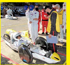
ドライバーの安全を守るため入念にチェック。