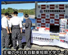
主催の中日本自動車短期大学ブース

Econo Power in GIFUは「省エネカー」「ハイブリッドカー」「電気自動車」に分類されたカテゴリでいかに低燃費で効率良く走ることができるかを競う大会です。学校法人神野学園 中日本自動車短期大学が主催し、これまで23年間開催されてきましたが、今年も昨年同様コロナ禍の影響もあり開催をするべきか検討されてきました。この大会に向け日々準備を進めている高校生達の情熱に応えたいと、昨年度に続き今年度も愛知・三重・岐阜の東海三県から高校生クラス、一般クラスに限定して開催が決定。JU岐阜もこの大会の趣旨に賛同しプロジェクト委員会を立ち上げ昨年からの協賛として大会をサポートしています。各カテゴリでエントリーされた車両がいかに低燃費で効率良く走ることができるか？ 1リットルのガソリンでどれくらいの距離を走行できるのか？ 高校生達の真剣に取り組む姿と熱いレースを取材してきました。