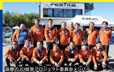
協賛のJU岐阜プロジェクト委員会メンバー