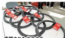
寄贈された省エネカー 競技車両用の専用タイヤ