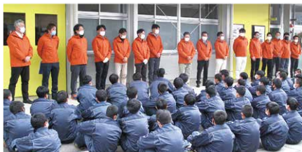
開講式の様子。今年も無事に開講できました。

12月8日(木)今回で8回目の開催となるこの企画は「地元関市のために我々が何か出来ることはないだろうか…」と、JU岐阜 中濃支部メンバーの強い思いから動き出したプロジェクト。若者の車離れが進みつつある昨今、自分たちで企画を考え、関市立関商工へ地域活動を提案。そして、賛同して頂いた同校との間で本企画が「教育活性化共同事業」として実現しました。講師の車に対する熱意ある指導と、生徒さん達が興味津々で話を聞き楽しく学ぶ姿が印象的でした。この活動が車業界の発展に繋がり、若者たちにもっと車を好きになってもらいたい、JU岐阜中濃支部メンバーのそんな願いが込められている講習でした。講師の皆さんも講習を受けた生徒の皆さんも有意義な時間を過ごされたと思います。