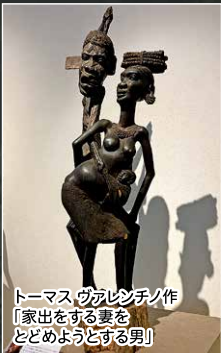
トーマス ウアレシチク作 「家出をする妻を とどめようとする男」