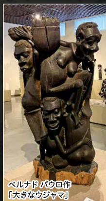
ベルナド バウロ作 「大きなウジャマ」