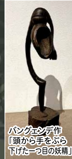
バンクエシデ作 「頭から手をぶら下げた一つ目の妖精」