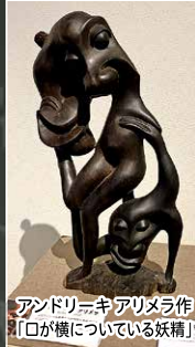
アンドロニキアリメラ作 「口が横になっている妖精」