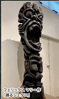
フェリックスマリー作 「踊るシェタニ」

シェタニの語源は「サタン」(悪魔)で、その昔、タンザニアとモザンビークの海岸に住む人々にアラブの貿易商たちが伝えたものです。マコンデ族ではシェタニを通常の動物とは考えられない生物、あるいは精霊にあてはめています。シェタニは、気まぐれに人を助けたり、困らせたりする伝説上の妖精で、人間、動物、怪物と好きなように姿を変えるとされています。マコンデ彫刻家の中に数多くのシェタニ作家が誕生し、民族的伝説や夢に出てくる出来事、希望などを自由に作品に取り入れています。