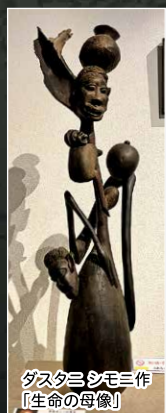
ダスタニシモ三作 「生命の母像」