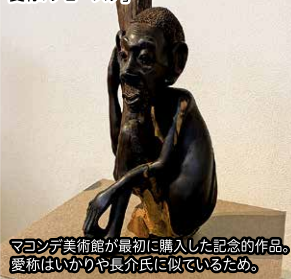
マコンデ美術館が最初で購入した記念的作品。 愛称はいかりや長介氏に似ているため。