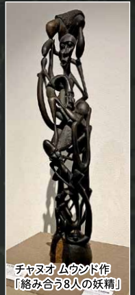
チャヌオムウンド作 「絡み合う8人の妖精」