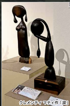
クレメンティ マティ作「涙」