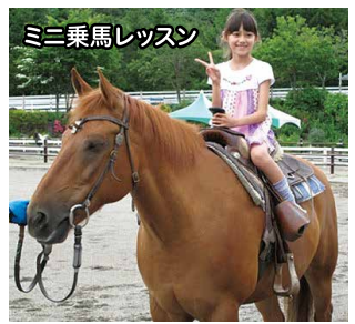
ミニ乗馬レッスン