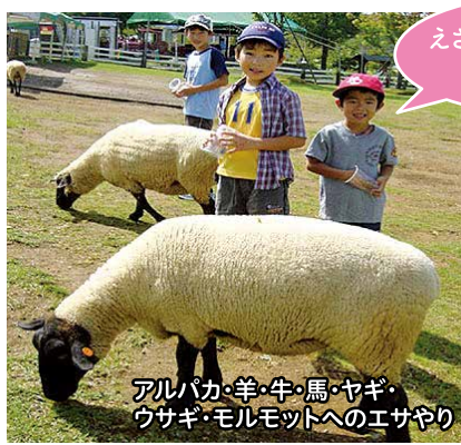
アルパカ・羊・牛・馬・ヤギ・ ウサギ・モルモットへのエサやり