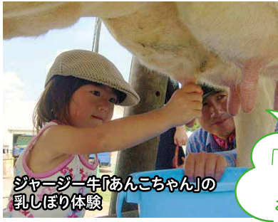
ジャージー牛「あんこちゃん」の 乳しぼり体験