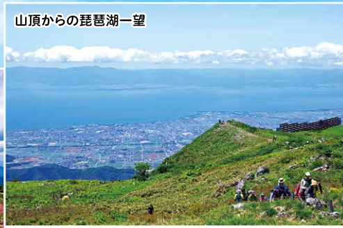
山頂からの琵琶湖一望

伊吹山山頂では春から秋にかけてたくさんの高山植物が咲きます。スカイテラス駐車場より山頂への登山コースでお花畑を楽しむことができます。