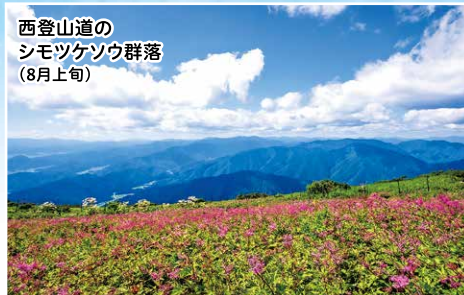
西登山道のシモツケソウ群落 (8月上旬)