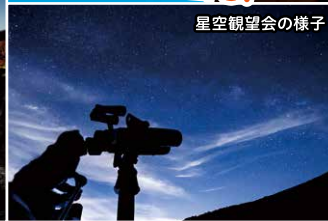
星空観望会の様子