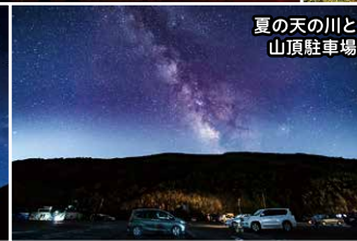
夏の天の川と山頂駐車場