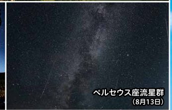
ペルセウス座流星群 (8月13日)