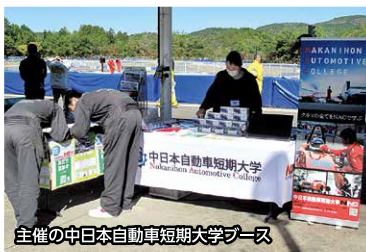
主催の中日本自動車短期大学ブース