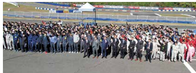
協賛のJU岐阜プロジェクト委員会メンバー

この大会に向け日々準備を進めている高校生達の情熱に応えたいと、今年度も愛知・三重・岐阜の東海三県から高校生クラス、一般クラスに限定して開催が決定。JU岐阜もこの大会の趣旨に賛同しプロジェクト委員会を立ち上げ協賛として大会をサポートしています。各カテゴリーでエントリーされた車両がいかに低燃費で効率良く走ることができるか？ 1リットルのガソリンでどれだけの距離を走行できるのか？ 高校生達の真剣に取り組む姿と熱いレースを取材してきました。