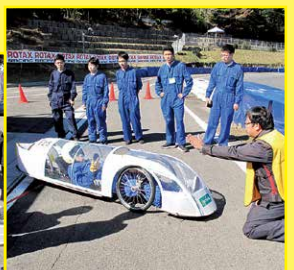
ドライバーの安全を守るため入念にチェック。