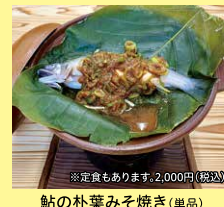
鮎の朴葉みそ焼き(単品) 1,200円(税込) ※定食もあります。2,000円(税込)