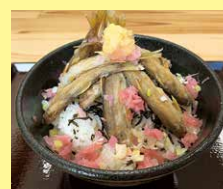
小鮎唐揚げ丼 900円(税込)