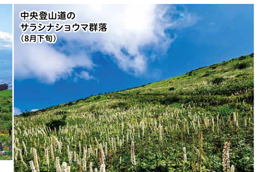
中央登山道の サラシナショウマ群落 (8月下旬)

伊吹山山頂では春から秋にかけてたくさんの高山植物が咲きます。スカイテラス駐車場より山頂への登山コースでお花畑を楽しむことができます。