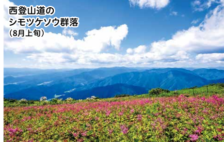
西登山道の シモツケソウ群落 (8月上旬)