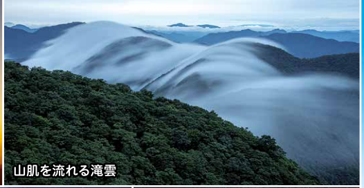
山肌を流れる滝雲