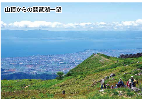
山頂からの琵琶湖一望

伊吹山山頂では春から秋にかけてたくさんの高山植物が咲きます。スカイテラス駐車場より山頂への登山コースでお花畑を楽しむことができます。