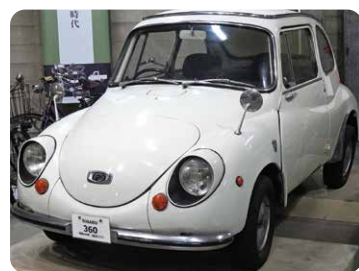
↑てんとう虫の通称で親しまれたスバル360。 富士重工業(現・SUBARU)が開発した 軽自動車で、1958年から1970年までのべ 12年間に亘り、約39万2,000台が生産された。

俗に「てんとう虫」と呼ばれるかわいらしいクルマです。実は、このクルマの車両重量が、なんと385kgだったのです。ちなみに、代表的な大型バイクであるハーレーダビッドソンのウルトラリミテッドローというモデルの重量は、415kgもあります。つまり、スバル360は4輪車であるにもかかわらず、バイクよりも軽かったのです。当時の軽自動車はタイヤが側溝に落ちてしまっても、2人で「よいしょ!」と声をかけて持ち上げれば簡単に脱出できました。また、方向転換が難しい狭い路地でも、バンパーに手をかけて持ち上げながら少しずつ方向転換することも可能でした。笑話のようですが、本当にそれくらい当時の軽自動車は軽かったのです。スバル360以外の軽自動車も当時は500kg以下の車重が普通でした。例えば1967年にホンダから発売された、N360というクルマの車両重量は475kg。このクルマは、現在ホンダから販売されているN-ONEのモチーフになったクルマですが、N-ONEの車重は軽量のノンターボモデルでも830kgもあります。