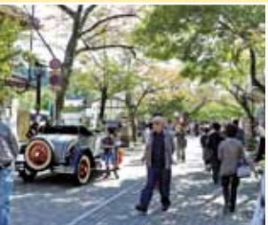
天候は快晴で昨年よりも多くのお客様が来場していました。

昨年に引き続き、今回も登場の日本で一台しかない揖斐川町谷汲のバス「宝くじ号」。車内に入ることもできました。