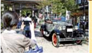
来場者の方々は、スマートフォンや一眼レフなどで多くの車両を撮影していました。