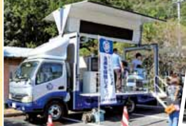
今回から登場したJAFによる車の衝突事故体験が出来るコーナーです。シートベルトの重要性を再認識できます。