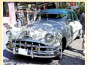
谷汲山華厳寺参道入口を飾る車両は1950年式ポンティアックチーフテン!