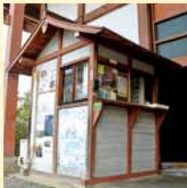
↑こちらが受付。受付をしてから堂内に入りましょう。