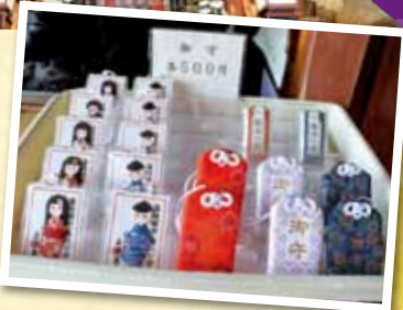
↑かわいらしい御守りやポストカードなどが販売されていました。お土産に最適!