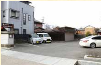
↑駐車場もあるので車で気軽に行くことができます。数台は止めることができます。

正法寺は平成26年3月18日に国の重要な文化的景観、長良川流域における岐阜の文化的景観に選定されました。↓