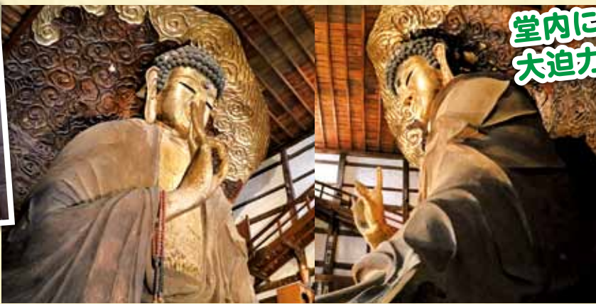
↑岐阜大仏の寸法は、像高:13.63m、顔の長さ:3.63m、目の長さ:0.85m、耳の長さ:2.12m、鼻の高さ:0.36m、口の幅:1.30mとなり、大きさは鎌倉の大仏の11.35mより大きく、迫力もあります。