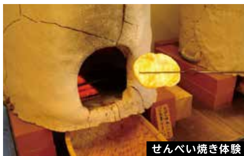
せんべい焼き体験

6月現在は体験メニューは休業していますが、ぎふ清流里山公園では様々な体験ができちゃう!