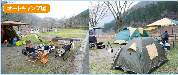
オートキャンプ場

キャンプ場はゆったりと使える54区画。ご家族から友人、ソロの方も！「テントや装備も流行りがあるんだ、私のなんか古くて」とおっしゃるキャンパーの男性は小学生の娘さんとキャンプを楽しんでいらっしゃいました。