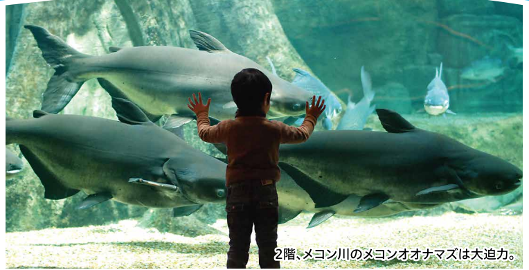
2階、メコン川のメコンオオナマズは大迫力。