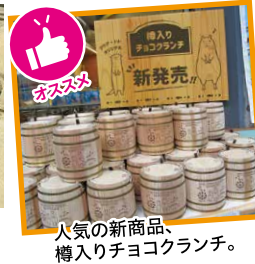
人気の新商品、樽入りチョコランチ。