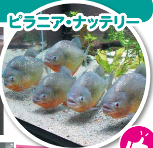
ピラニア・ナツペリー