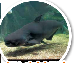
メコンオオナマズ