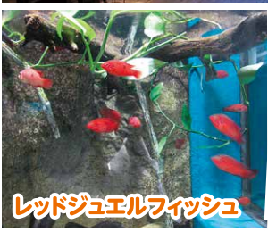
レッドジュエルフィッシュ