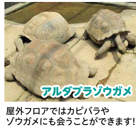
アルダブラゾウガメ