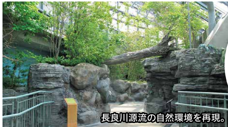
長良川源流の自然環境を再現。