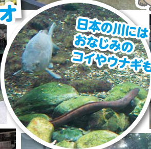
日本の川には おなじみの コイやウナギも!