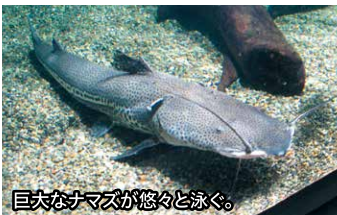
巨大なナマズが悠々と泳ぐ。