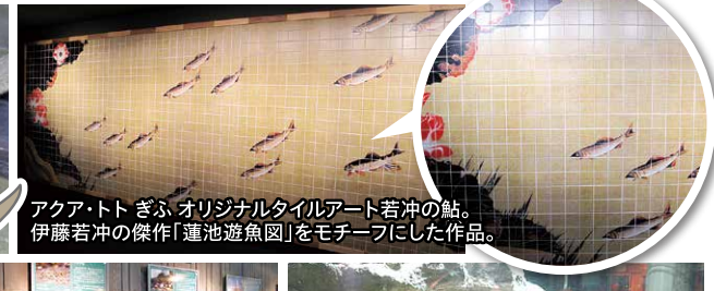
アクア・トト ぎふ オリジナルタイルアート若沖の鮎。伊藤若沖の傑作「蓮池遊魚図」をモチーフにした作品。