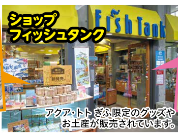
ショップ フィッシュタンク