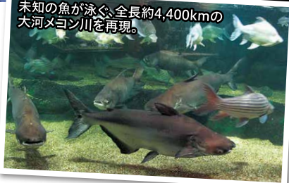
未知の魚が泳ぐ、全長約4,400kmの大河メコン川を再現。