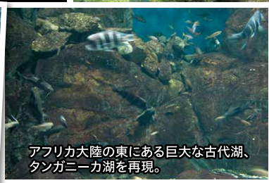
アフリカ大陸の東にある巨大な古代湖、タンガニーカ湖を再現。