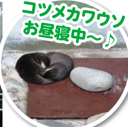
コツメカワウソ お昼寝中～♪