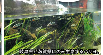
岐阜県と滋賀県にのみ生息するハリヨ。