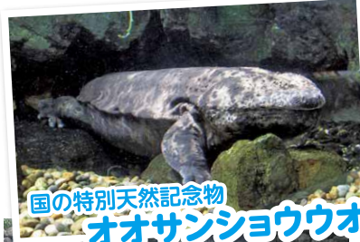
国の特別天然記念物 オオサンショウウオ