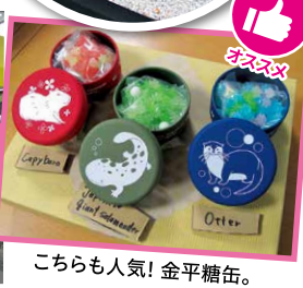
こちらも人気！金平糖缶。